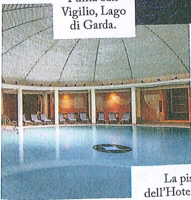
La piscina dell'Hotel Caesius Thermae & Spa Resort, a Bardolino.