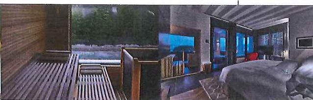
La Vital Junior Suite. Misura 40-45 mq ed è arredata con materiali ecosostenibili. A sinistra, la sauna finlandese dove depurare l'organismo.