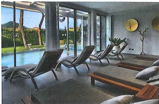
L'area relax con i lettini e le chaise longue. Si affaccia sul giardino e sulla piscina H203 Pool, con acqua termale e micro bolle di ozono.