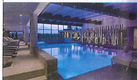
La piscina interna di acqua termale con temperatura che, a seconda della stagione, varia dai 34 ai 36 °C, offre rilassanti giochi di luce e la vista sul giardino.

• Info: Hotel Esplanade Tergesteo, Montegrotto Terme (Pd). Tel. 049.8911777; www.esplanadetergesteo.it