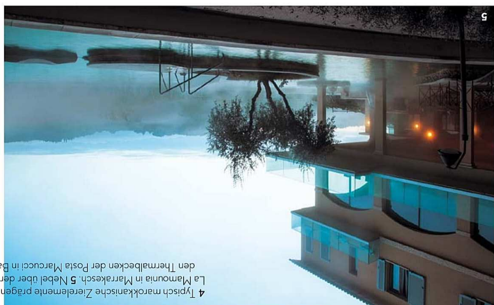
4 Typisch marokkanische Zierelemente prägen die Suite der La Mamounia in Marrakesch. 5 Nebel über der Toskana und den Thermalbecken der Posta Marcucci in Bagno Vignoni