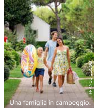
Una famiglia in campeggio.