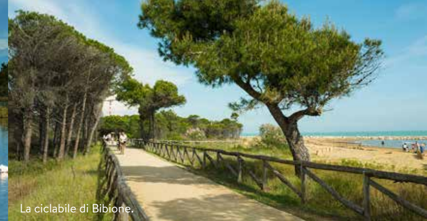
La ciclabile di Bibione.