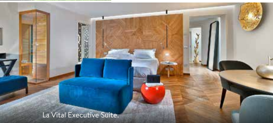
La Vital Executive Suite.

DORMIRE • Esplanade Tergesteo Relax & Sonno Retreat da 6 a 10 notti, visita medica, 1 trattamento con Onde Binaurali, 5 applicazioni fango Detox, 1 massaggio Ocean Dream, 2 massaggi Abyhanga da 1.614 euro a persona. Doppia in b&b da 350 euro ( esplanadetergesteo.it ; montegrotto.org ).