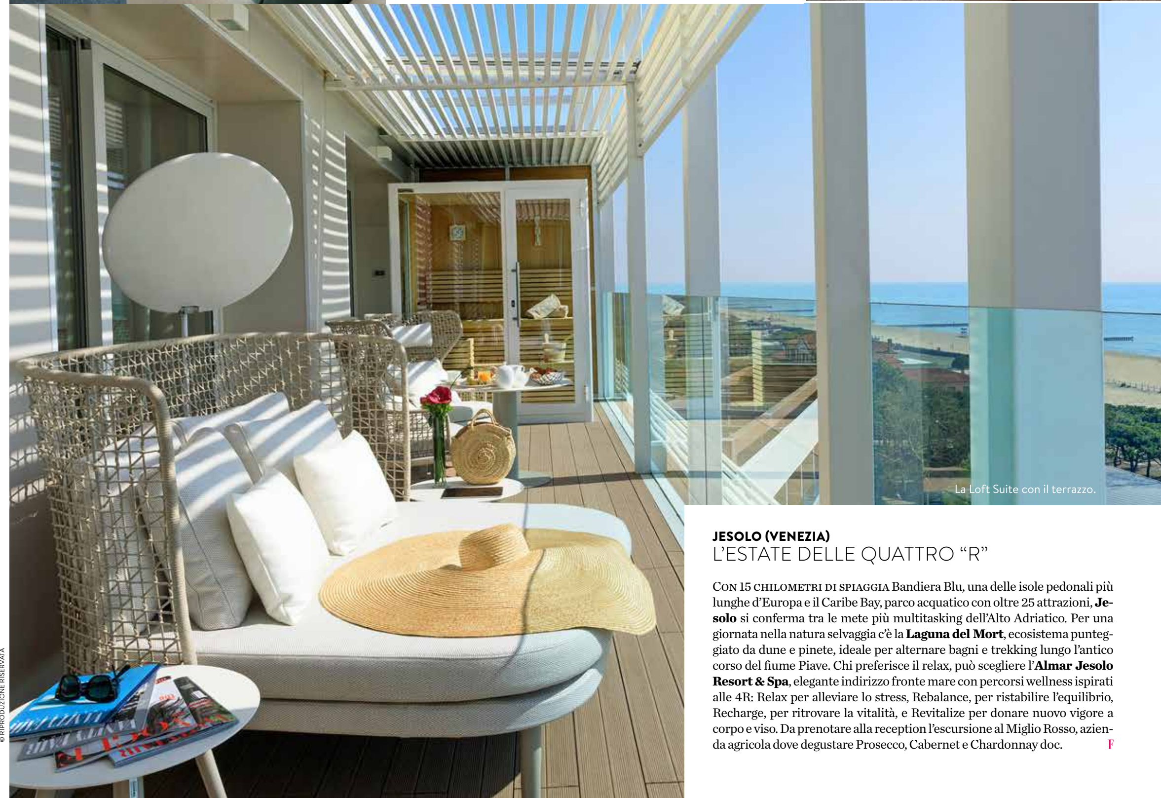
La Loft Suite con il terrazzo.