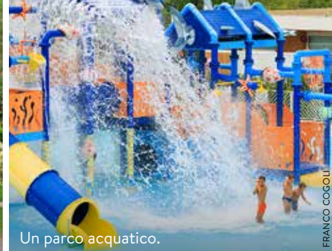
Un parco acquatico.