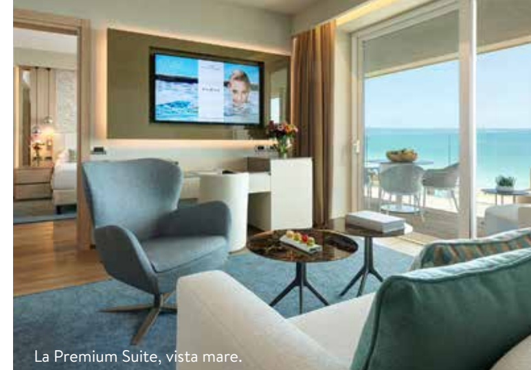
La Premium Suite, vista mare.

DORMIRE • Esplanade Tergesteo Relax & Sonno Retreat da 6 a 10 notti, visita medica, 1 trattamento con Onde Binaurali, 5 applicazioni fango Detox, 1 massaggio Ocean Dream, 2 massaggi Abyhanga da 1.614 euro a persona. Doppia in b&b da 350 euro ( esplanadetergesteo.it ; montegrotto.org ).