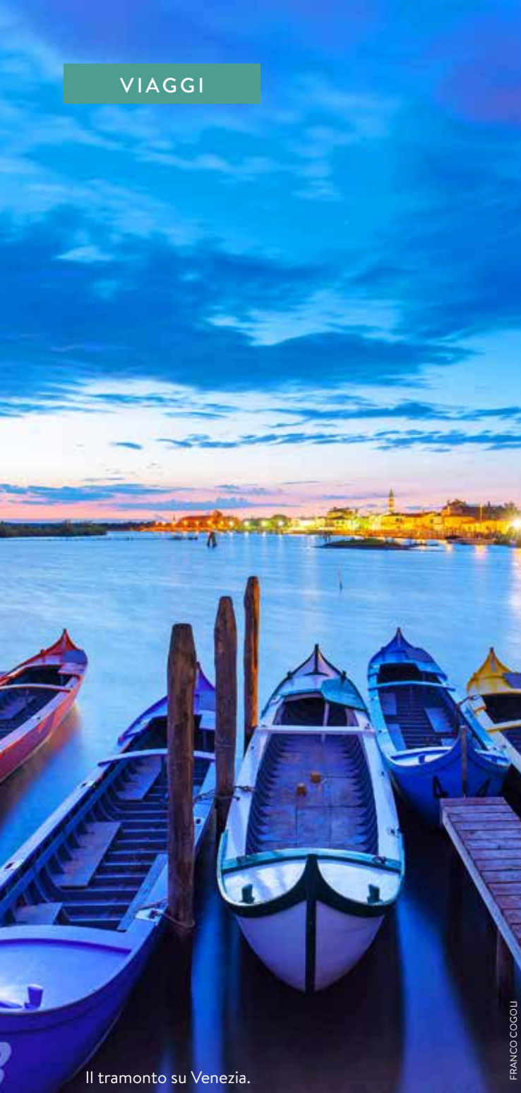
Il tramonto su Venezia.