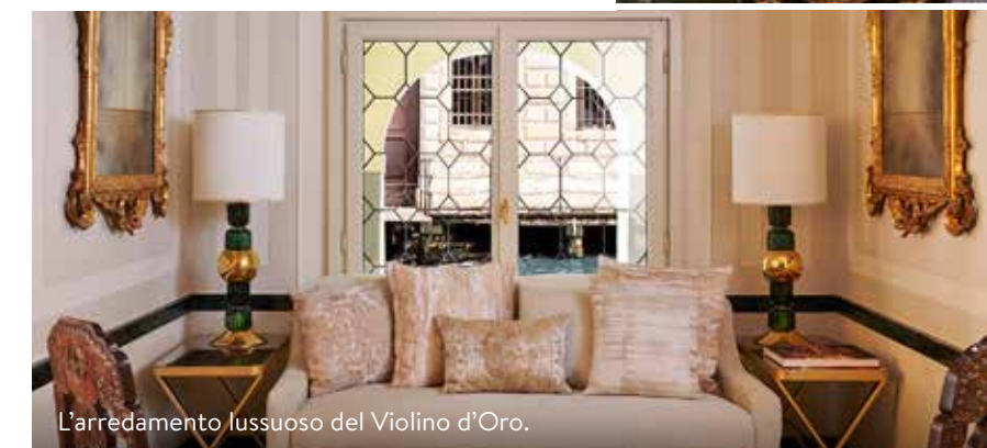
L'arredamento lussuoso del Violino d'Oro.

DORMIRE • Violino d'Oro Nel Sestiere San Marco, un boutique hotel con arredi di design e artigianato. Spaziose camere e suite, ristorante fine dining Il Piccolo. Doppia in b&b da 996 euro ( violinodoro.com ; vенеziunica.it ).