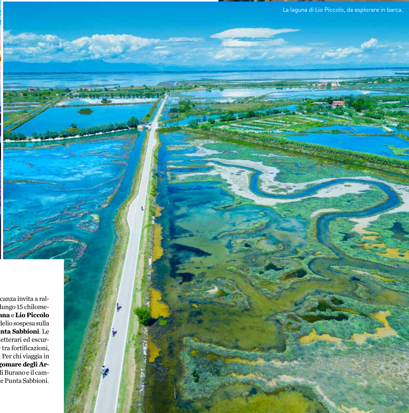
La laguna di Lio Piccolo, da esplorare in barca.