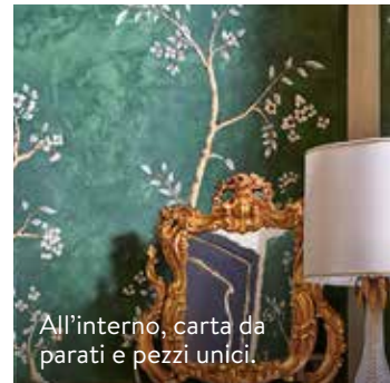
All'interno, carta da parati e pezzi unici.