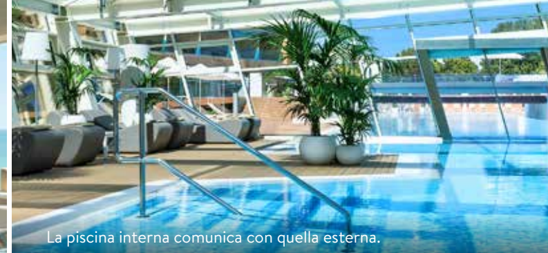
La piscina interna comunica con quella esterna.

DORMIRE • Almar Jesolo Resort & Spa Almablu Wellness & Spa, piscina, spiaggia, palestra. Doppia in b&b da 460 euro a notte (minimo 2). Benessere in fiore: due notti in b&b con massaggio e trattamento viso da 250 euro al giorno a persona in Deluxe Seafront View ( almarjesolo.com ; jesolo.it ).