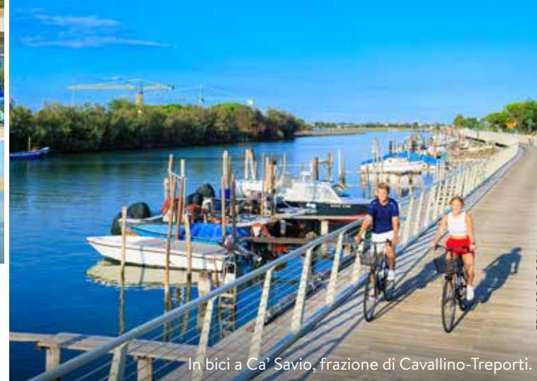
In bici a Ca' Savio, frazione di Cavallino-Treporti.

Un campeggio pet friendly a cinque stelle con lodge, tende, piazzole. Camping Home Design da 6 posti con cucina, 2 bagni, terrazza, spiaggia, due notti da 375 euro ( unionlido.com ; visitcavallino.com ).