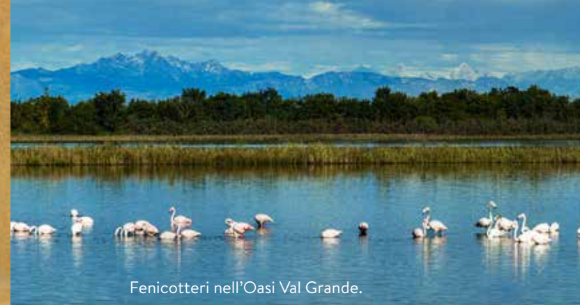
Fenicotteri nell'Oasi Val Grande.