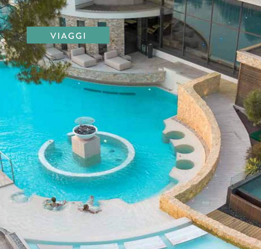
Le piscine dell'Esplanade Tergesteo.