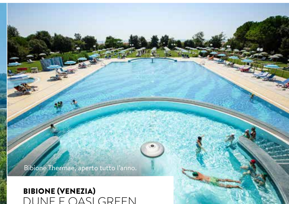
Bibione Thermae, aperto tutto l'anno.