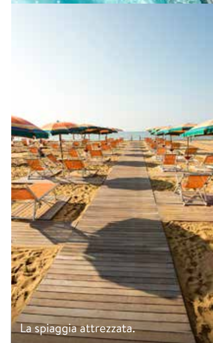
La spiaggia attrezzata.

CON OLTRE 30 CHILOMETRI DI PISTE CICLABILI, Bibione invita a pedalare: lungo la Passeggiata Adriatica, dal Faro di Punta Tagliamento a Bibione Pineda , dune fossili si alternano alla macchia mediterranea. Punta Capalonga è il regno delle specie protette. Dopo il fratino, è tornata a nidificare la beccaccia di mare, segno della salute dell'ecosistema costiero di Bibione, tra le mete balneari più frequentate d'Italia. Per scoprire l'area protetta, tra lagune e zone umide, si organizza un bike tour all' Oasi Naturalistica Val Grande , popolata da fenicotteri rosa. E per chi ama il mare, la spiaggia di otto chilometri è stata la prima senza fumo d'Europa. Nel 2026 la località celebra 70 anni. Si festeggia con il programma Bibione Be Active: fitness sulla sabbia e relax al polo termale Bibione Thermae.