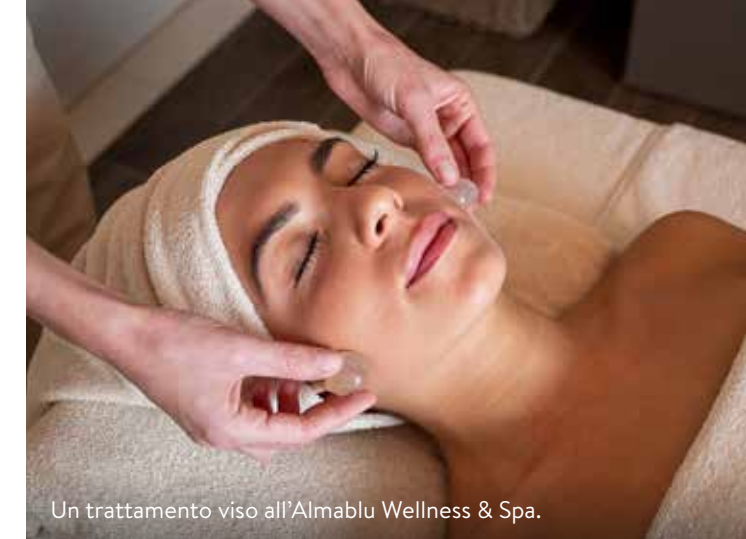
Un trattamento viso all'Almablu Wellness & Spa.

DORMIRE • Almar Jesolo Resort & Spa Almablu Wellness & Spa, piscina, spiaggia, palestra. Doppia in b&b da 460 euro a notte (minimo 2). Benessere in fiore: due notti in b&b con massaggio e trattamento viso da 250 euro al giorno a persona in Deluxe Seafront View ( almarjesolo.com ; jesolo.it ).